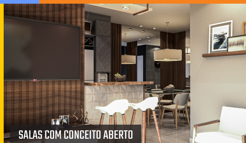
SALAS COM CONCEITO ABERTO